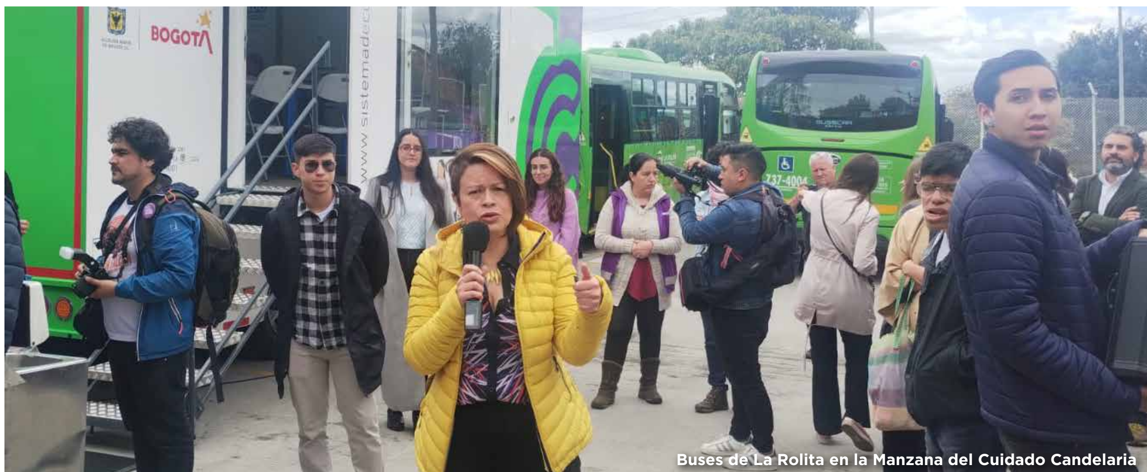
Buses de La Rolita en la Manzana del Cuidado Candelaria

Invitados nacionales e internacionales fueron los pasajeros VIP de La Rolita durante el 28 y 29 de junio, para conocer todas las estrategias de cuidado que tiene el Distrito, especialmente la apuesta de la empresa por una movilidad sostenible con equidad de género.