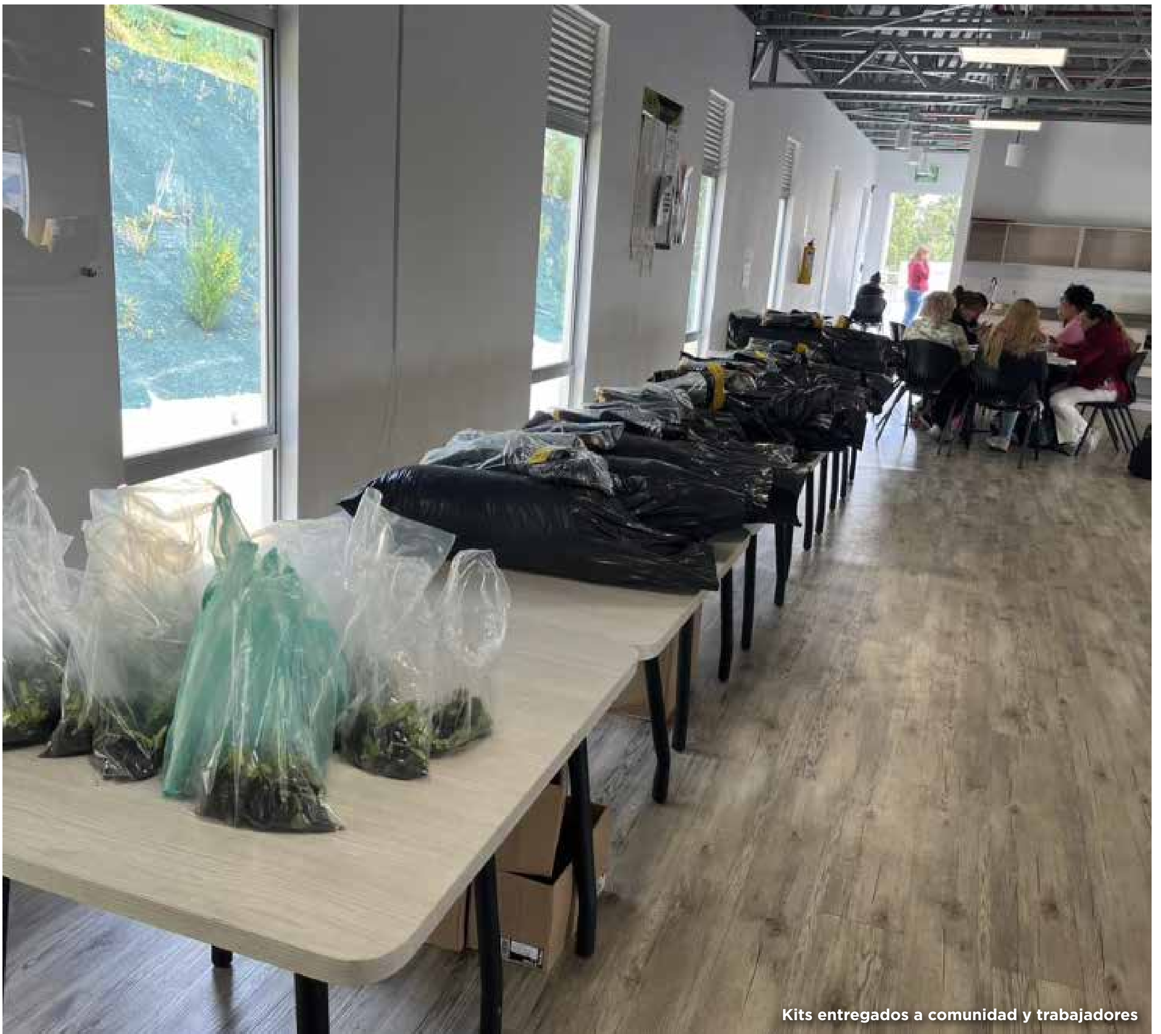
Kits entregados a comunidad y trabajadores