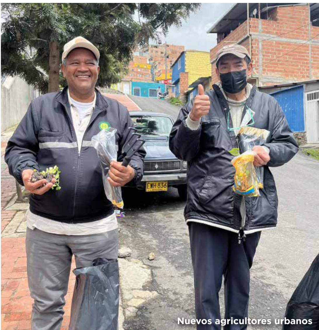
Nuevos agricultores urbanos