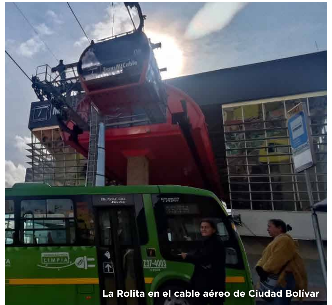
La Rolita en el cable aéreo de Ciudad Bolívar

Así se leyó en las noticias de medios de comunicación, donde informaron también que la investigación y conocimiento directo tanto en mantenimiento como en operación, le permitirá optimizar los recursos, a lo que se suma la mejora de componentes tecnológicos y de infraestructura, y un mayor control y supervisión sobre los costos operativos del sistema, traduciéndose en un servicio más eficiente para Bogotá. La dependencia de terceros privados también se verá disminuida y ello permitirá que el distrito tenga mayor autonomía.