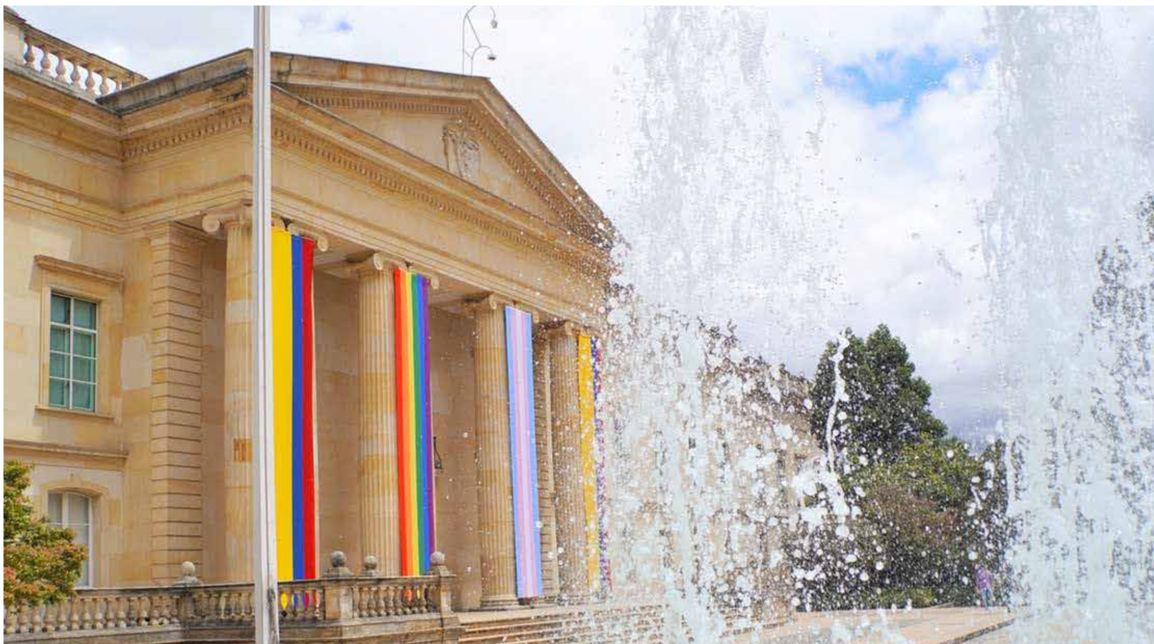
Por primera vez, la Casa de Nariño se vistió con los colores del orgullo LGBTQ+ como un símbolo de reconocimiento y celebración de la diversidad.