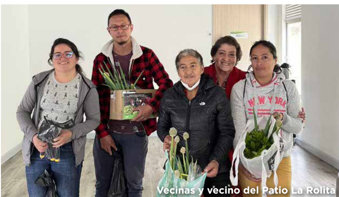
Vecinas y vecino del Patio La Rolita

Tres talleres se realizaron con una asistencia total de setenta personas trabajadoras o vecinas de La Rolita para crear su propia huerta urbana en casa, con el apoyo del Jardín Botánico se entregó un kit a cada una de ellas.