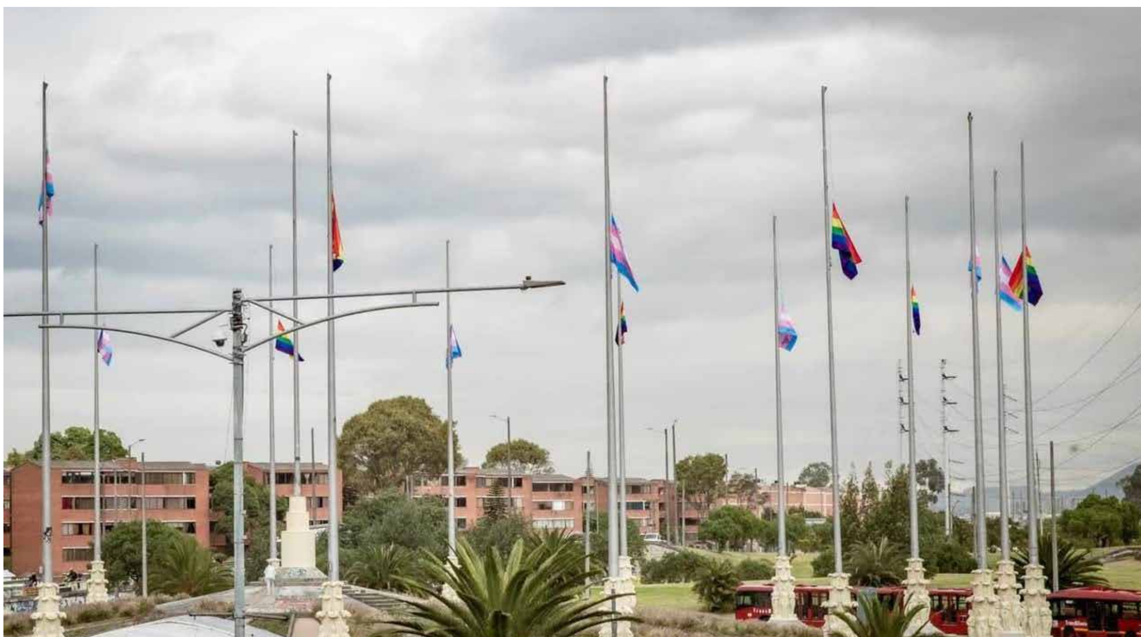
En un emotivo acontecimiento, la Alcaldía de Bogotá conmemoró el mes del orgullo LGBTQ+ a través de un simbólico acto: la izada de 20 banderas que simbolizan a esta población LGBTQ+, en el emblemático Monumento a Banderas, ubicado en la localidad de Kennedy.