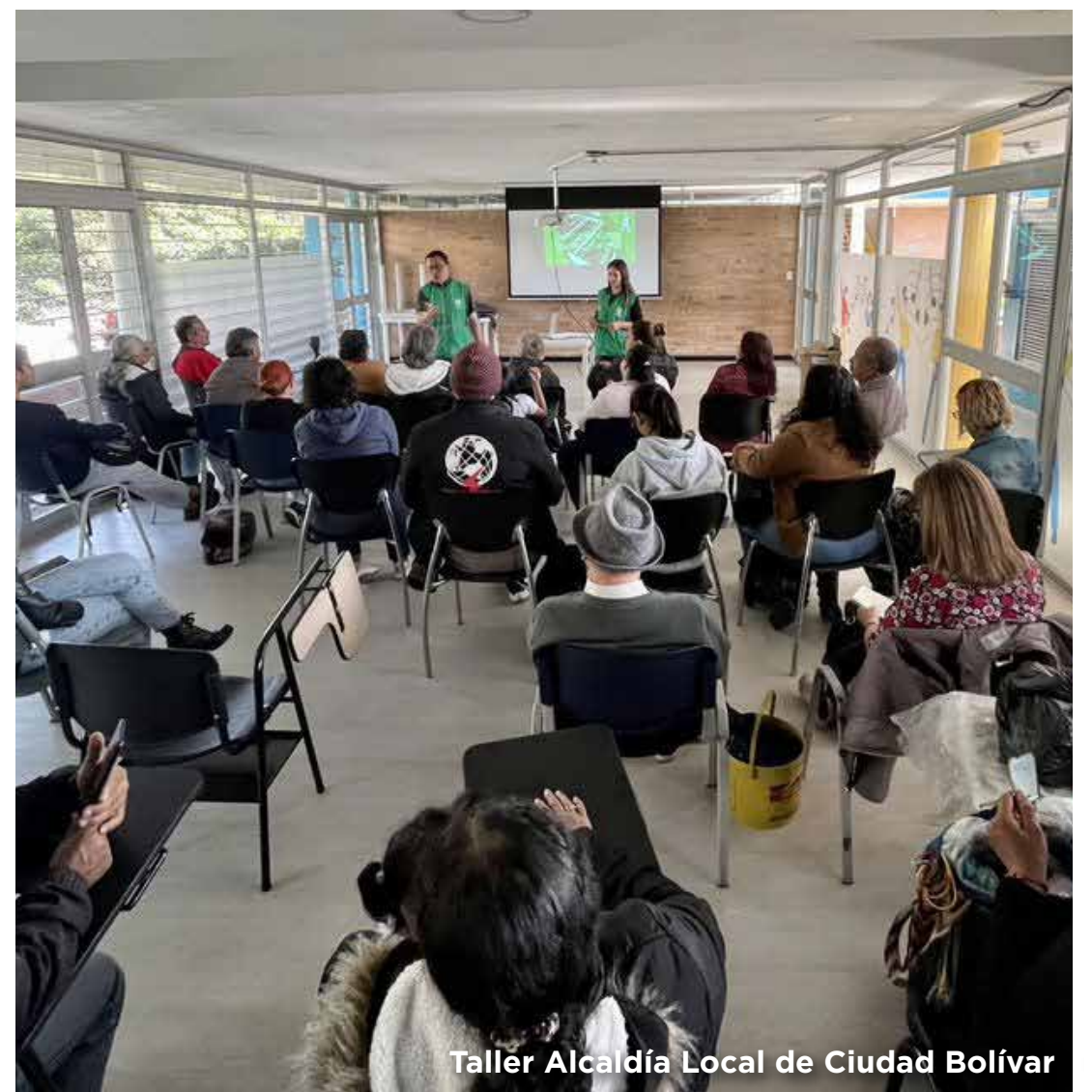
Taller Alcaldía Local de Ciudad Bolívar

El primero tuvo lugar el 5 de junio en el auditorio Supercade Manitas, vinculando a 18 personas de la comunidad al programa La Rolita Reverdece Tu Entorno, a quienes se sumaron el 9 de junio 30 trabajadores y vecinos que asistieron al taller realizado en el patio, mientras otras 22 personas de la comunidad se vincularon en el taller realizado en la Alcaldía de Ciudad Bolívar.