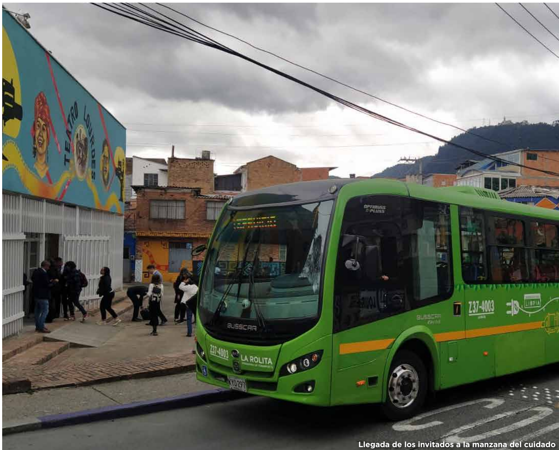
Llegada de los invitados a la manzana del cuidado