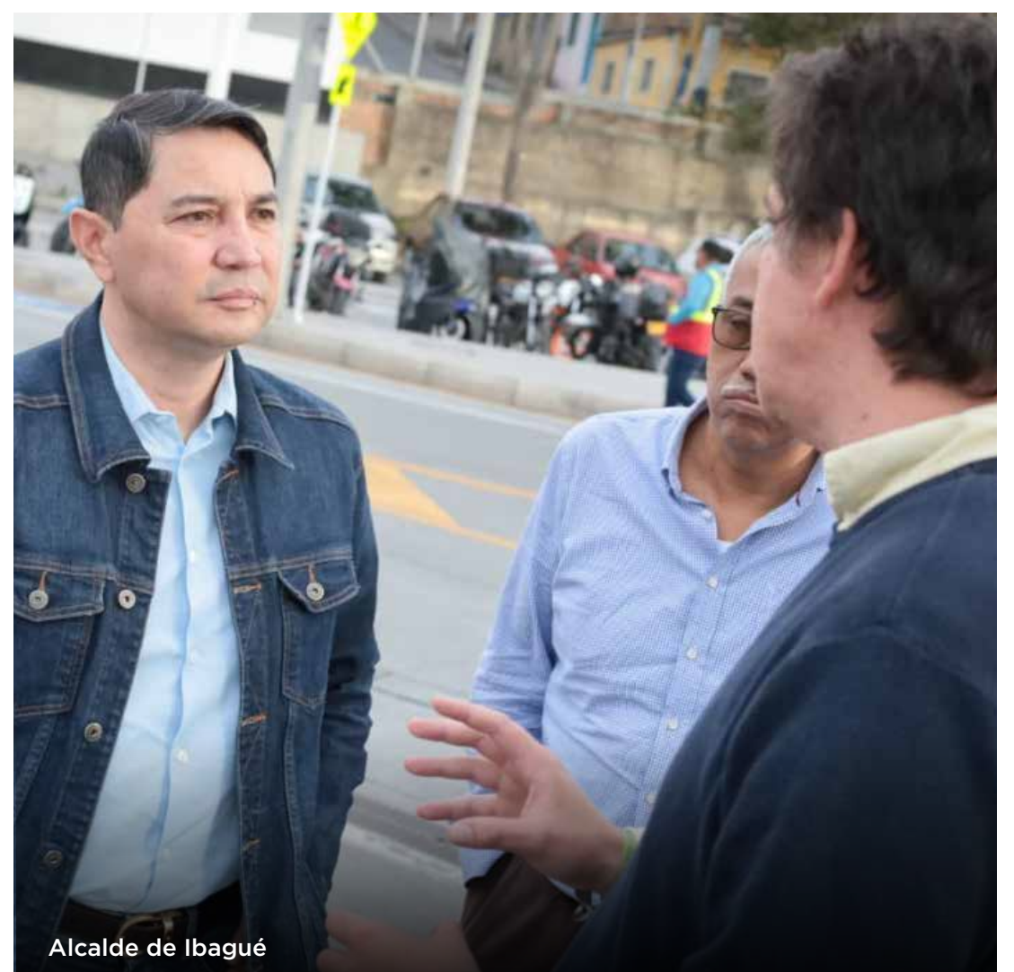
Alcalde de Ibagué