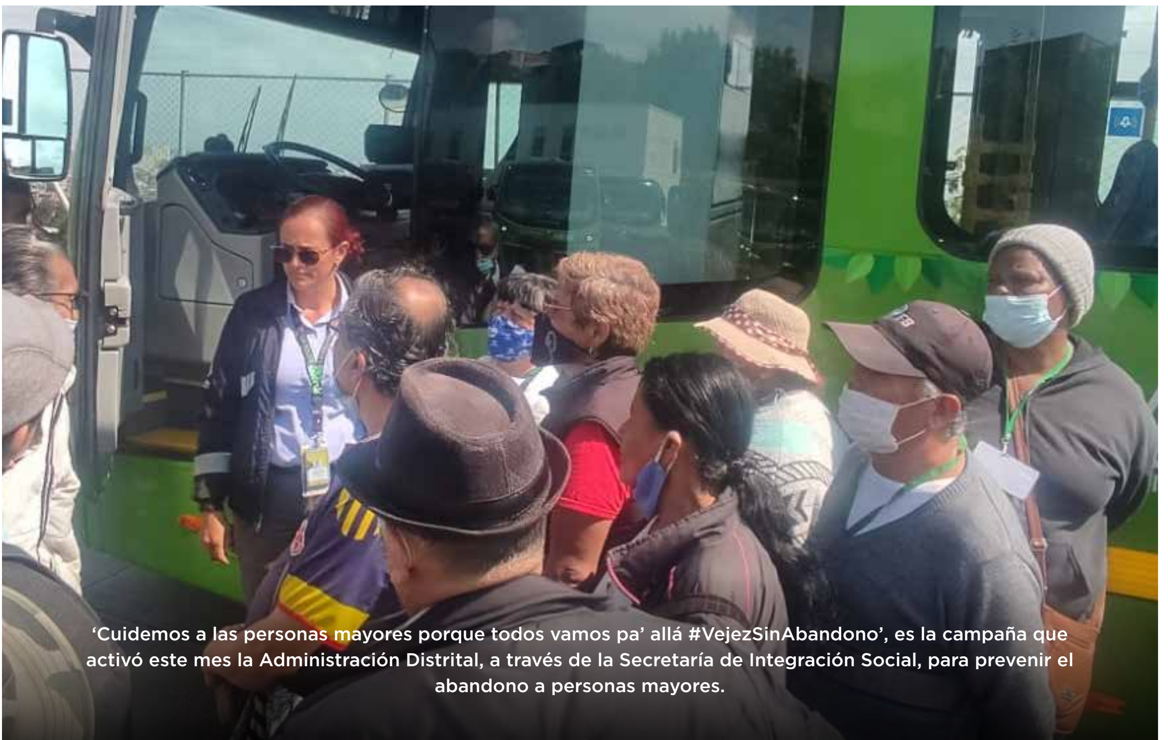
‘Cuidemos a las personas mayores porque todos vamos pa’ allá #VejezSinAbandono’, es la campaña que activó este mes la Administración Distrital, a través de la Secretaría de Integración Social, para prevenir el abandono a personas mayores.