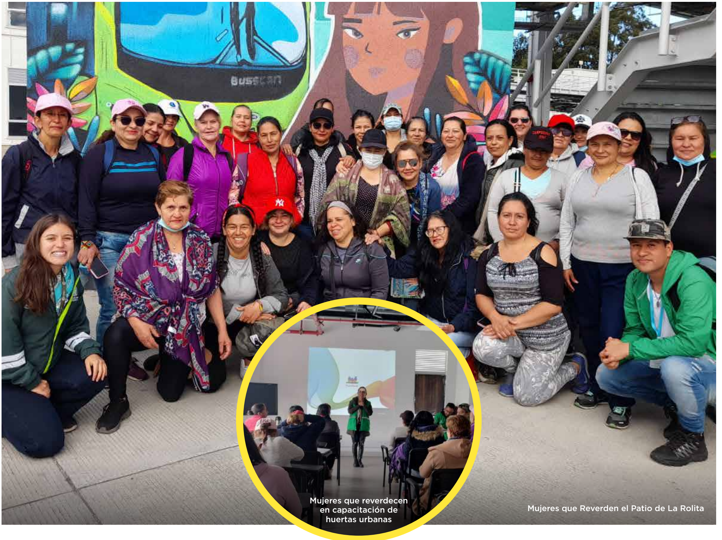
Mujeres que reverdecen en capacitación de huertas urbanas