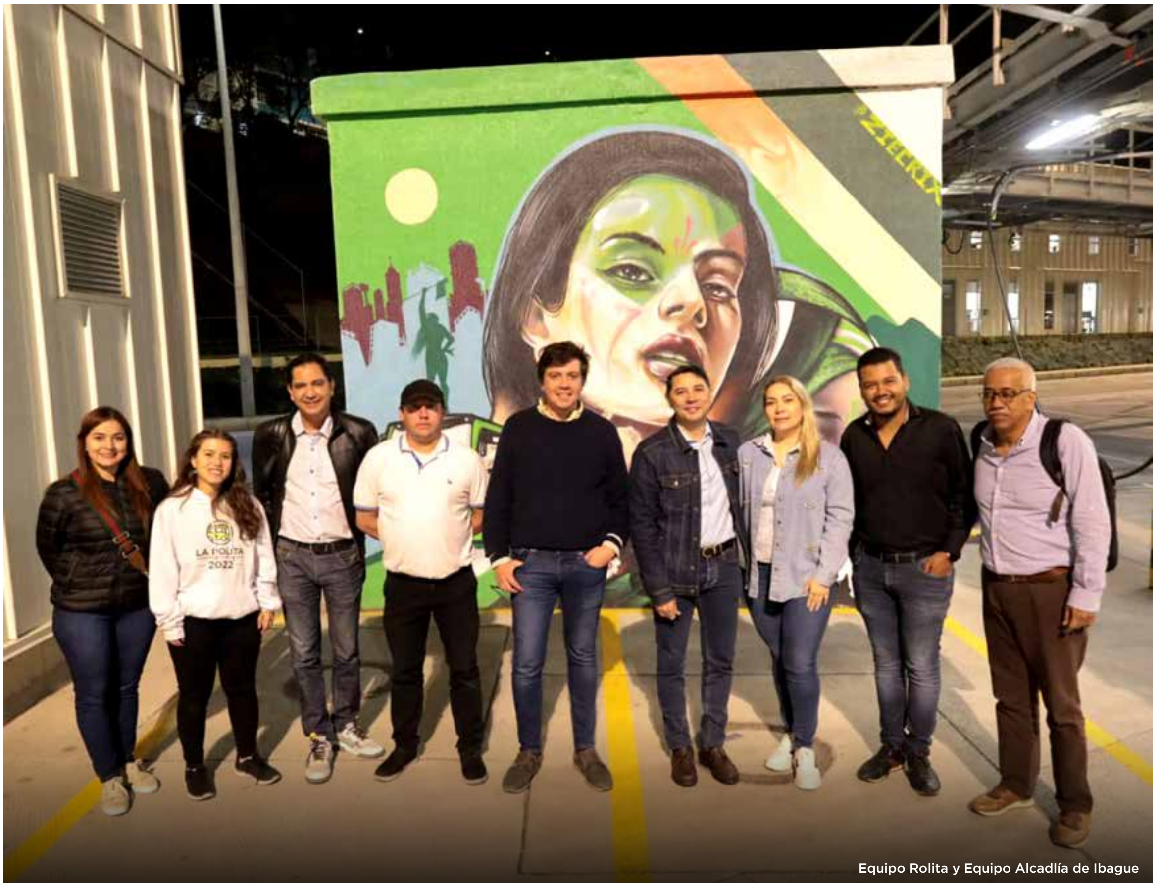
Equipo Rolita y Equipo Alcaldía de Ibagué

El alcalde de Ibagué visitó por segunda vez el Patio Perdomo La Rolita para conocer, en detalle, las fortalezas y los retos de crear un Operador Público para la ciudad.