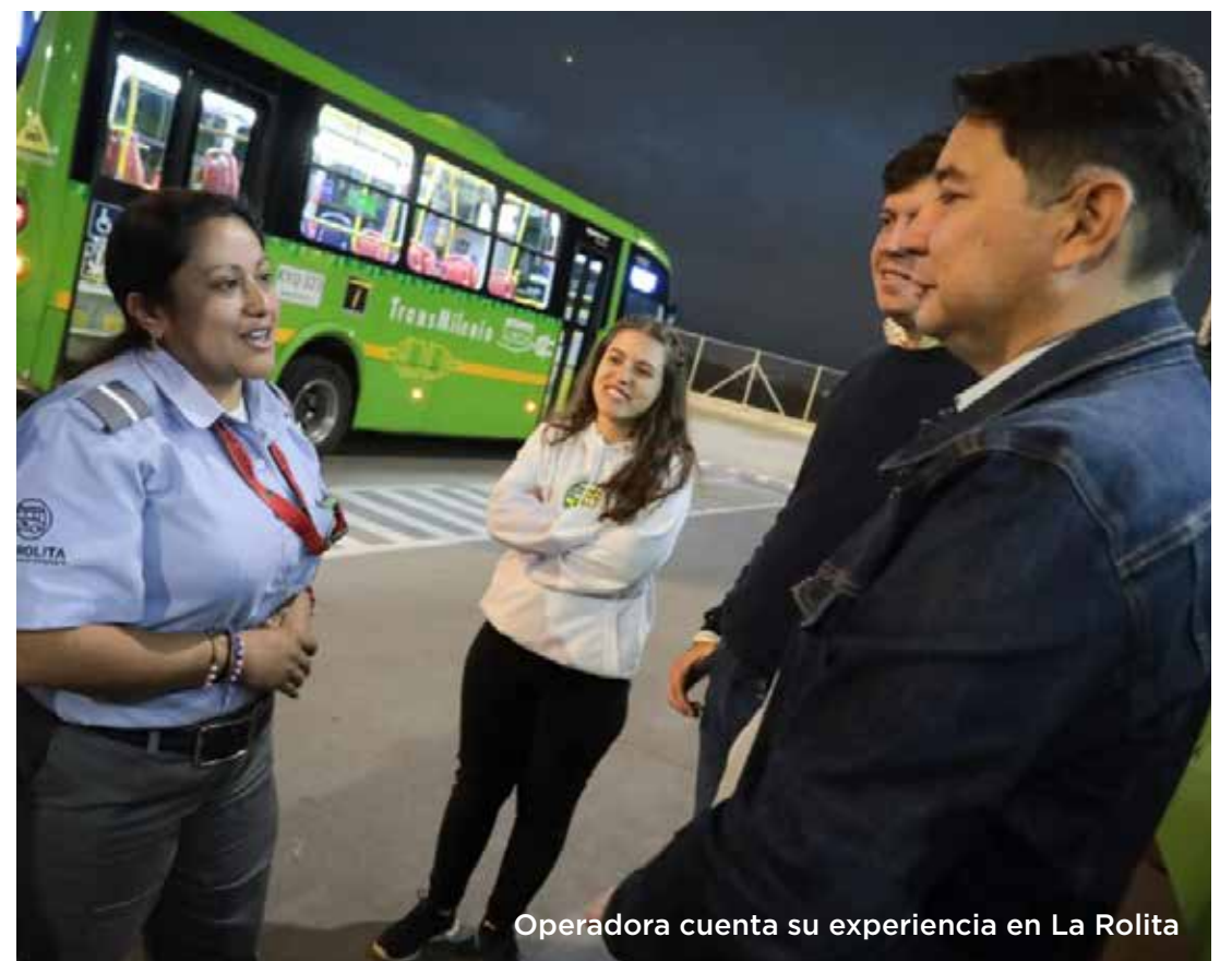
Operadora cuenta su experiencia en La Rolita

No obstante, dados los buenos resultados obtenidos por La Rolita en sus primeros 10 meses de operación, el Alcalde ve la oportunidad de tener también una Operadora Pública de Transporte similar a La Rolita, incluso, con enfoque de género y gran apuesta por la sostenibilidad, pues considera que es un modelo positivo para replicar en varias ciudades del país.