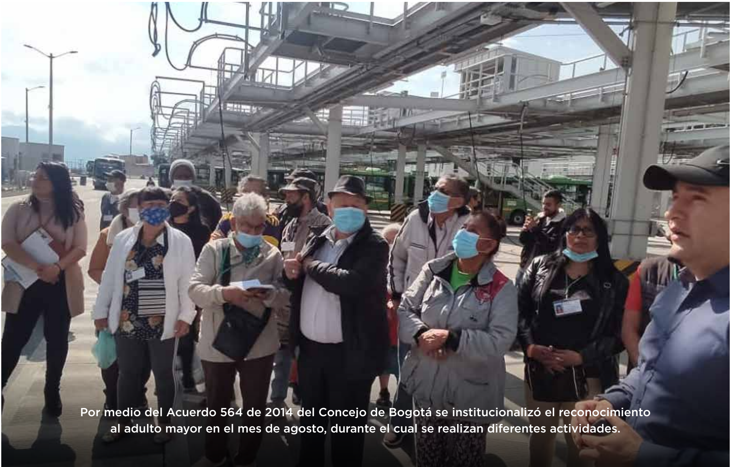
Por medio del Acuerdo 564 de 2014 del Concejo de Bogotá se institucionalizó el reconocimiento al adulto mayor en el mes de agosto, durante el cual se realizan diferentes actividades.